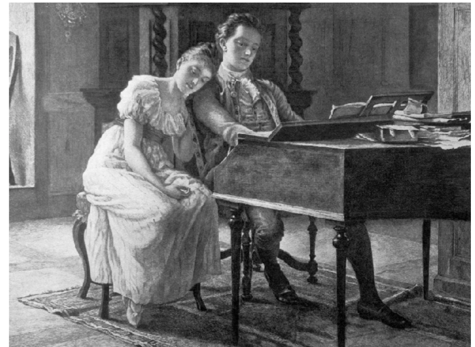
Felix Mendelssohn met zijn zus Fanny